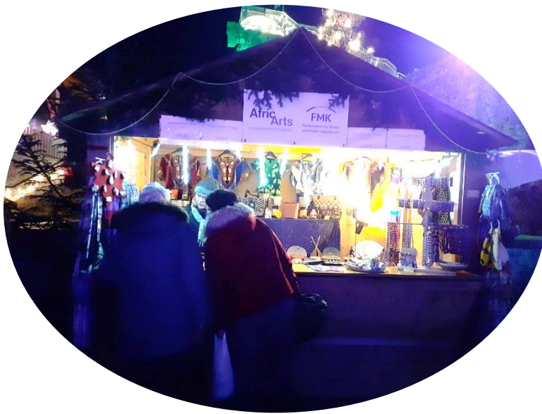
Infostand mit Verkauf von Kunsthandwerk am Weihnachtsmarkt Lupburg

In diesem Jahr engagierten sich wieder viele Menschen auf ganz unterschiedliche Weise, um den Verein finanziell zu unterstützen. Allen gemeinsam ist jedoch der große zeitliche und organisatorische Einsatz, der zu wunderbaren Ergebnissen