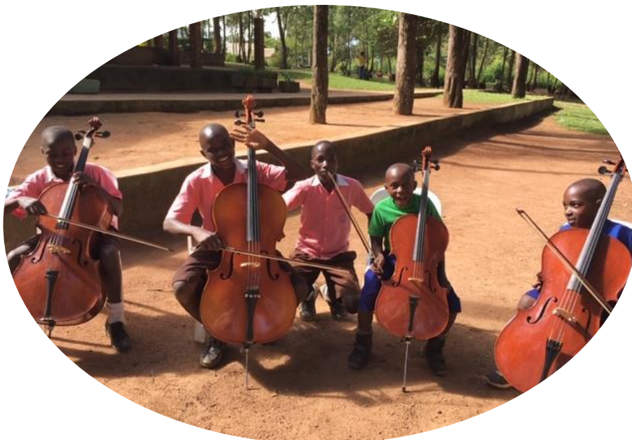
Seit 2019 kann man an der IMLS nun auch Cello, verschiedene Blechblasinstrumente sowie Djembe lernen.