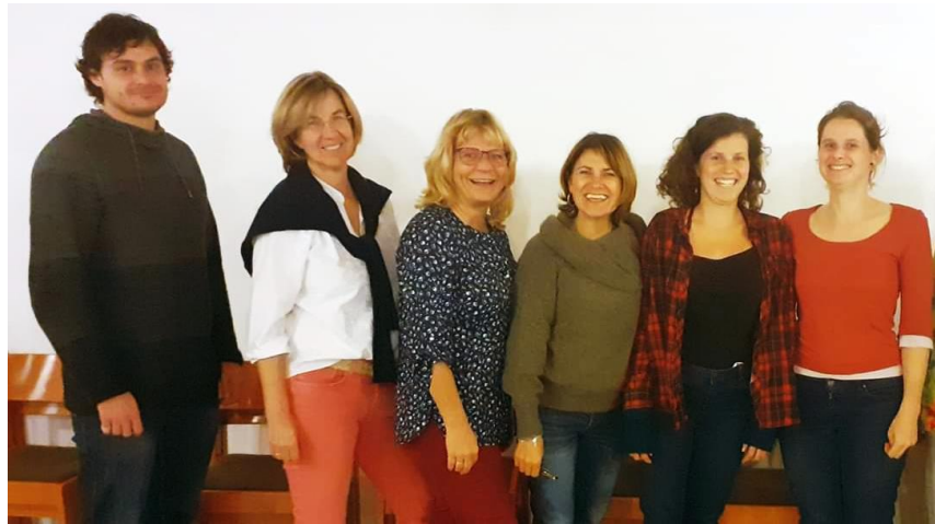
Das Kreativ-Team aus den jeweiligen Leitern der AGs.

Zur Unterstützung der Vorstandschaft wurden 2019 Arbeitsgruppen mit verschiedenen Tätigkeitsfeldern sowie das aus den jeweiligen Leitern der AGs gebildete Kreativ-Team ins Leben gerufen. Die AG Öffentlichkeitsarbeit betreut u.a. den Newsletter, die Socialmedia-Auftritte so-