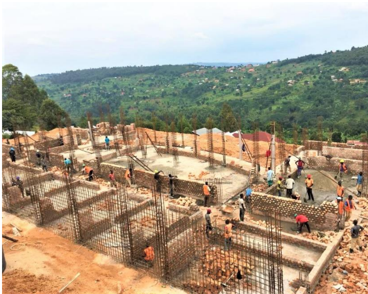
Die Baustelle des neuen IMLS Gebäudes

Im März 2019 konnte endlich mit der Umsetzung unseres großen Ziels – der Bau der neuen IMLS mit einem eigenen großen Schulgebäude – begonnen werden. Das Hanggrundstück erforderte ein tief- reichendes Fundament sowie entsprechend verstärkte Absicherungen der Hangrückwand. Ein sehr tiefes und stabiles Fundament wurde daher und aufgrund der Bodenbeschaffenheit im Erdreich verankert.