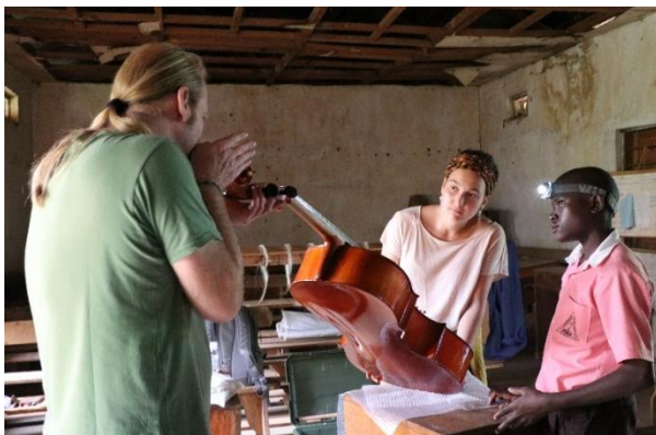
Reparaturbedürftige Instrumente werden wieder gerichtet.

Nach dem bereits stattgefundenen ersten Besuch von Lehrern der Sing- und Musikschule an der IMLS konnte der Gedanke einer Partnerschaft zwischen beiden Musikschulen erfolgreich vertieft und weiterverfolgt werden. So besuchten im Herbst 2019 erneut elf Lehrer der Sing- und Musikschule Regensburg die IMLS. Die Wiedersehensfreude und neue Kontakte unterstreichen die Motivation beider Schulen an einer Kooperation. Während des Besuchs konnten die Schüler nach bestandener Prüfung ein Zertifikat erwerben, was mit Elan, Engagement und Be-