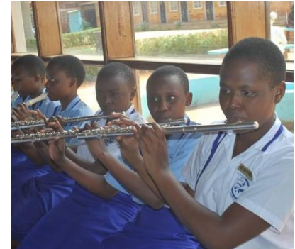
Instrumentalunterricht in einer der Outreach-Schulen.

Für Kinder im Alter zwischen sieben und 15 Jahren fanden zudem in jeden Schulferien ein musikalisches Ferienprogramm mit Musiktheorie, Instrumentalunterricht, Orchester und Chor statt. Spiel und Spaß rundeten das Programm ab und brachten neben dem Üben die nötige Zerstreuung. Höhepunkte dieser besonderen Ferienzeit bildeten das Abschluss-Examen mit Zertifikatvergabe sowie ein großes Abschluss-Konzert, bei dem sich das Publikum an den Klängen der erst jung formierten Bigband, des IMLS-Chores, der Solo-Musiker und kleiner Ensembles begeisterte.