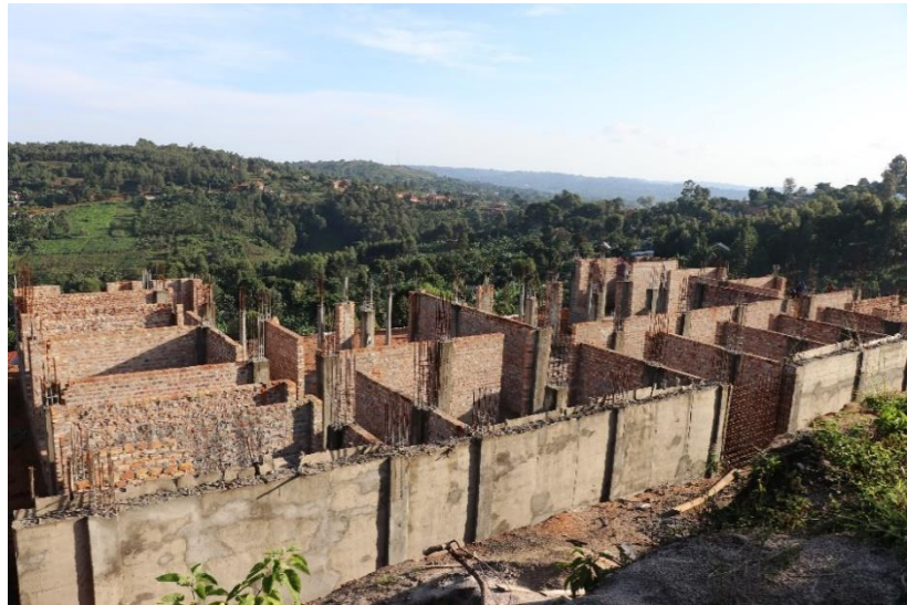
Hier entsteht das neue Schulgebäude, das aus mehreren Stockwerken bestehen soll.

Die oben erwähnte Kostensteigerung zu Beginn und die intransparente, steigende Kostenkalkulation des ursprünglich beauftragten Ingenieursteam hatten zur Folge, dass die finanziellen Mittel für weitere Baufortschritte fehlten. Im Herbst 2019 wurde daher zunächst ein vorläufiger Baustopp verhängt. Die IMLS hat die Kostenkalkulationen des Ingenieurs durch einen externen Controller überprüfen lassen, der eine Überteuerung feststellte. Daraufhin wurde ein neuer Ingenieur beauftragt. Zugleich gründete die IMLS ein gemischt besetztes Construction-Team aus Mit-