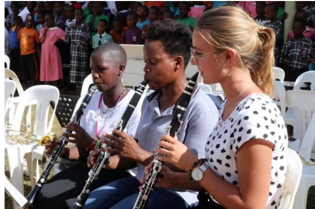
Bereicherung für beide Seiten: Unterricht an der IMLS durch Freiwillige aus Deutschland.

Im Jahr 2019 waren sieben Freiwillige aus Deutschland an der IMLS tätig. Erstmals wurde vor Beginn des Freiwilligenaufenthalts ein musikpädagogisches Vorbereitungsseminar in Regensburg durchgeführt, um die Freiwilligen auf die Aufgaben vor Ort vorzubereiten und sie kulturell einzuführen. Im Seminar wurden musikpädagogische und pädagogische Konzepte und Ansätze aufgezeigt, die von den jungen Menschen als hilfreiche praktische Hinweise gerne aufgenommen wurden, genauso wie die Inhalte zu ugandischer Kultur, Gesellschaft und Landeskunde.