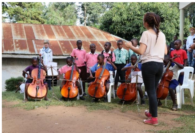
Eine Weltwärts-Freiwillige gibt Cellounterricht an der IMLS.

Über den entwicklungspolitischen Freiwilligendienst „Weltwärts“ der Bundesregierung konnten zudem zwei Freiwillige über die Entsendeorganisation „Freunde der Erziehungskunst Rudolf Steiners e.V.“ an die IMLS entsandt werden. Diese seit August 2019 laufenden Möglichkeit bereichert die IMLS und den dortigen Freiwilligendienst, da die Aufenthalte für die Dauer eines ganzen