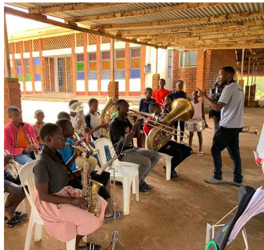
Erstmals an der IMLS möglich: das Spielen in einer Big Band mit verschiedenen Blechblasinstrumenten.

Das Lehrangebot an Instrumentalunterricht an der IMLS konnte im Lauf des Jahres sukzessive erweitert werden. Dank der großzügigen Instrumentenspenden aus Deutschland sind mittlerweile als neue Unterrichtsfächer hinzugekommen: Unterricht in Djembe, Cello, Blechblasinstrumente wie Saxophon, Trompete, Posaune und Horn. Dies ermöglicht nun auch das Spielen im Orchester, in einer Blaskapelle und einer Band. Darüber hinaus wurden ein Kinder- und ein Erwachsenenchor an der IMLS gegründet, die sich regen Zuspruchs erfreuen und große Fortschritte machen.