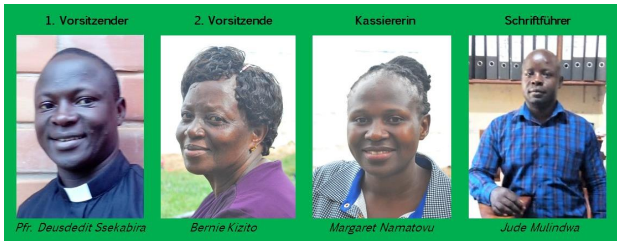
Der IMLS and Friends Vorstand

Mit steigenden Schülerzahlen und dem wachsenden Angebot an Instrumenten hat sich auch die Anzahl der Lehrer der IMLS nach oben entwickelt. Zur Deckung des erweiterten Angebots stellte die IMLS einige Lehrer neu ein. Erfreulicherweise trägt die IMLS deren Kosten bereits selbst und zeigt eindrucksvoll, dass sich die IMLS dem erklärten Ziel der finanziellen Unabhängigkeit schrittweise nähert. Insgesamt arbeiten 14 hauptamtlich angestellte und sechs ehrenamtliche Mitarbeiter an der IMLS. Die ehrenamtlichen Mitarbeiter kommen sowohl aus Deutschland als auch aus Uganda und sind Freiwillige oder ehemalige Schüler der IMLS. In Summe betreute die IMLS 943 Schüler, davon 859 im Outreach-Programm.