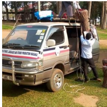
Der Bus der IMLS wird voll beladen mit Instrumenten.