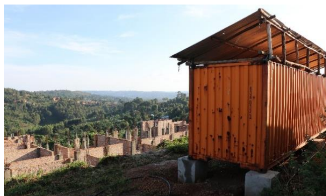
Der Container ist endlich am Zielort angekommen.

Der bürokratische Aufwand und die Kosten des ganzen Projekts waren erheblich. Daher ist ein erneuter Transport in dieser Form zunächst nicht angedacht. Gleichwohl hat sich der zeitliche und finanzielle Aufwand gelohnt, sind doch nunmehr die Bildung eines Orchesters sowie Gruppenunterricht möglich. Zudem übersteigt der wirtschaftliche Wert der gelieferten Instrumente bei Weitem die Transportkosten. Der gekaufte Container selbst wurde überdacht und dient als Lagerraum.