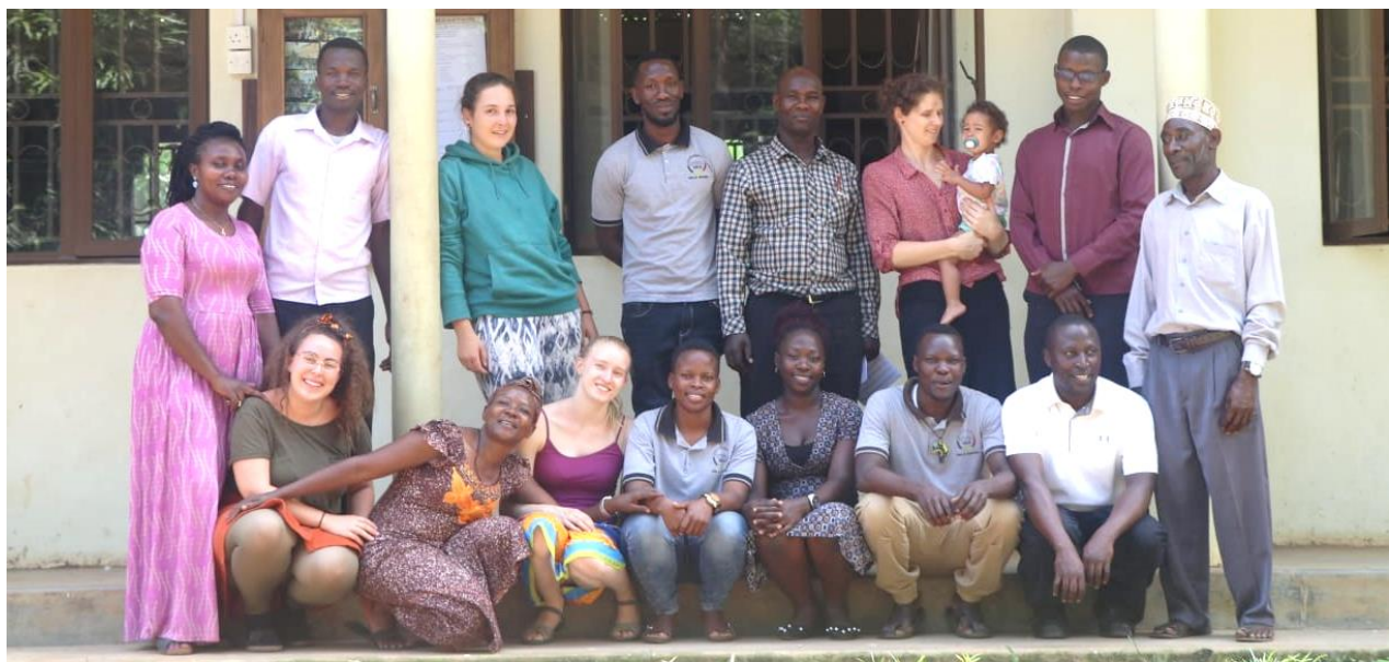
Hier zu sehen: Die Schulleitung mit dem aktuellen Lehrpersonal der IMLS, den Freiwilligen und Teile der Vorstände von IMLS & Friends und dem FMK Uganda e.V.

Mit steigenden Schülerzahlen und dem wachsenden Angebot an Instrumenten hat sich auch die Anzahl der Lehrer der IMLS nach oben entwickelt. Zur Deckung des erweiterten Angebots stellte die IMLS einige Lehrer neu ein. Erfreulicherweise trägt die IMLS deren Kosten bereits selbst und zeigt eindrucksvoll, dass sich die IMLS dem erklärten Ziel der finanziellen Unabhängigkeit schrittweise nähert. Insgesamt arbeiten 14 hauptamtlich angestellte und sechs ehrenamtliche Mitarbeiter an der IMLS. Die ehrenamtlichen Mitarbeiter kommen sowohl aus Deutschland als auch aus Uganda und sind Freiwillige oder ehemalige Schüler der IMLS. In Summe betreute die IMLS 943 Schüler, davon 859 im Outreach-Programm.