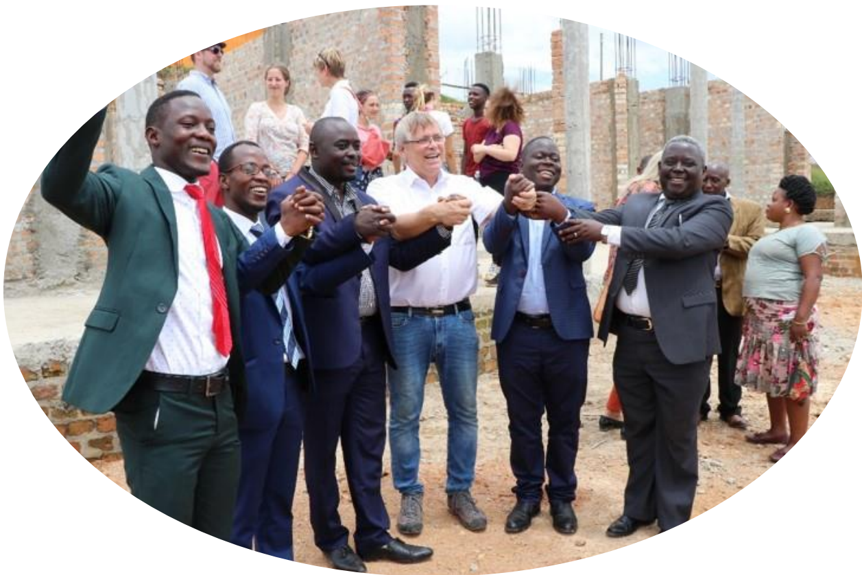
Eine kulturelle und gesellschaftliche Bereicherung: Das Partnerschaftsprojekt der Sing- und Musikschule der Stadt Regensburg und der IMLS.