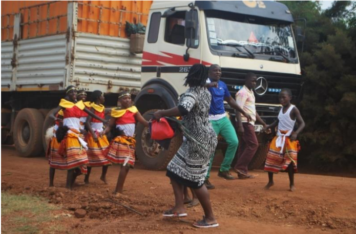
Mit viel Begeisterung wird der Container voller Instrumente empfangen.

Der lange Weg des Containers von Deutschland nach Uganda und der große Aufwand lohnten sich: im Sommer 2019 kam der Transport endlich mit den zahlreichen Instrumenten und dem Zubehör bei der IMLS an.