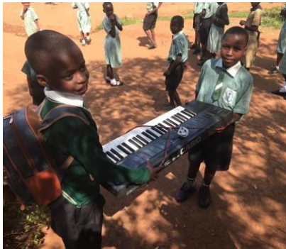
Alle packen beim Ein- und Ausladen der Instrumente mit an.

Im sogenannten „Outreach-Programm“ erteilen die Lehrer der IMLS zusätzlichen Musik- und Instrumentalunterricht an sieben allgemeinbildende Schulen, davon sechs Grundschulen. An diesen Schulen unterrichtet die IMLS gegen Entgelt.