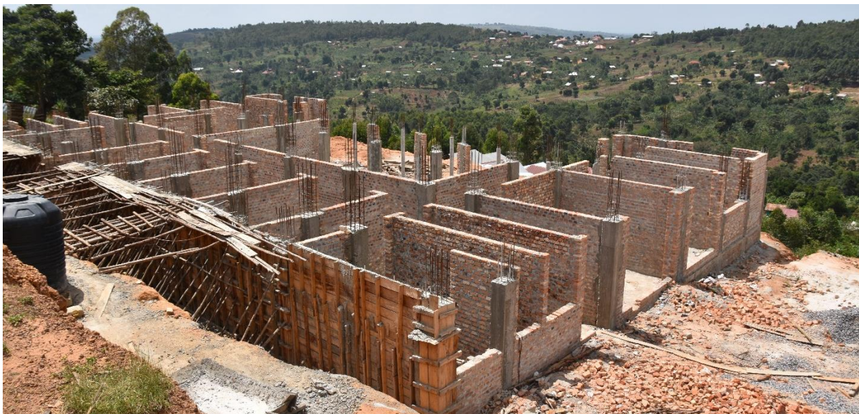
Eines der großen Projekte 2019: Der Bau des neuen Schulgebäudes der IMLS beginnt.

*Auf Grund der besseren Lesbarkeit wird in diesem Jahresbericht auf die weibliche Form verzichtet, es sind jedoch stets alle Geschlechter angesprochen.