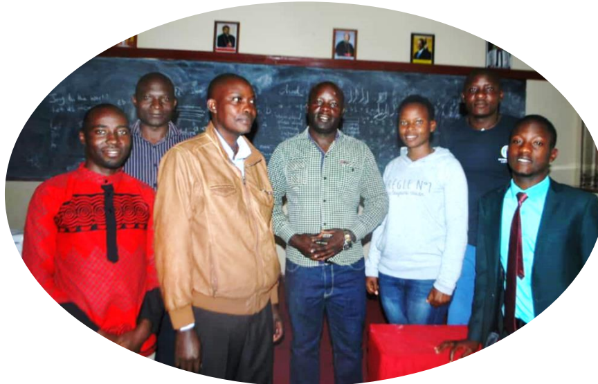
Hier zu sehen: das Construction Team für das neue Schulgebäude der IMLS.

arbeitenden der IMLS, dem Architekten und der Bauleitung, das die Einhaltung und Umsetzung der anwaltlich abgeschlossenen Verträge überwacht. Nachdem unter anderem durch den Spendenbrief der Weihnachtsaktion finanzielle Mittel vorhanden sind und die Regenzeit zu Ende ist, wird im Februar 2020 mit der Decke weitergebaut werden. Die größtenteils von Hand durchgeführten Arbeiten gingen insgesamt zügig voran. Die großen Baufortschritte lassen einen bereits jetzt die künftige IMLS mit ihrem Wirken und ihren Möglichkeiten erahnen.