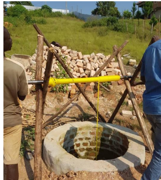
Der Brunnen auf dem IMLS Gelände

So rutscht das Gebäude bei Starkregen nicht den Hang hinab, wodurch sich die Mehrkosten des Fundaments, das in Zukunft auch mehrere Stockwerke tragen kann, nachhaltig auszahlen. Im Anschluss wuchsen die Mauern, Wände wurden gezogen, Pfeiler und die stützende Hangrückwand errichtet. Parallel wurde zur Sicherstellung einer wirtschaftlichen Wasserversorgung ein Brunnen auf dem Gelände der neuen IMLS gegraben.