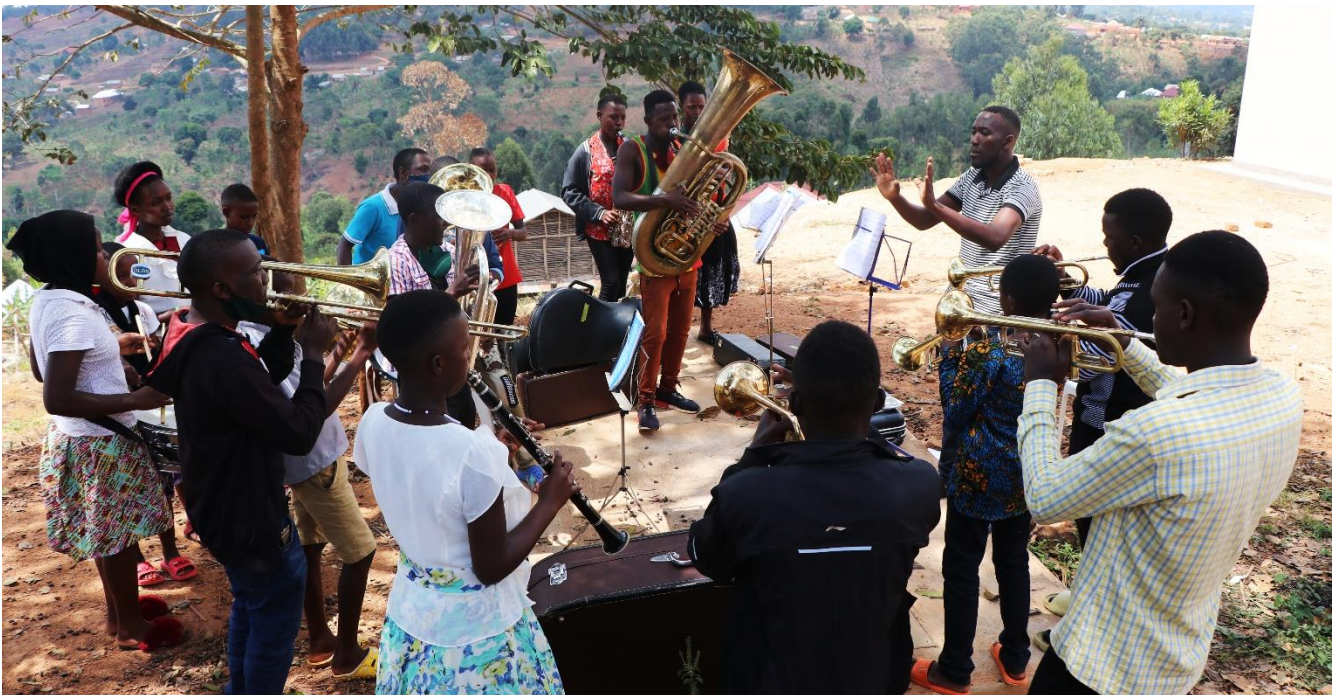
IMLS-Brass Band beim Proben

In Deutschland wurde unter anderem erneut eine virtuelle Spenden- und Sportchallenge, die diesmal unter dem Motto „Kalorien für Melodien“ stand, erfolgreich durchgeführt und ein Online-Shop zum digitalen Erwerb von ugandischem Kunsthandwerk auf der Vereins-Website eingerichtet.