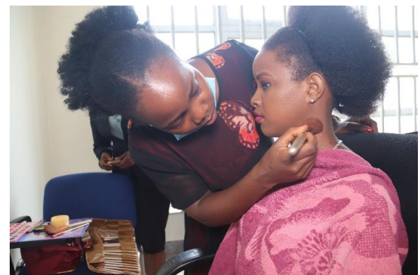
Cosmetology and Hair Dressing