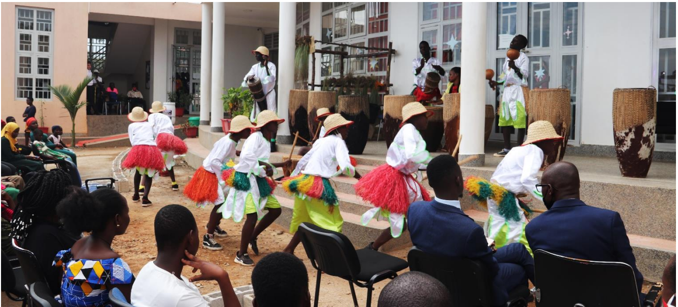
Krippenspiel als Theater und tänzerische Darbietung präsentiert beim IMLS-Weihnachtskonzert

hochgeladenen Musikvideos wie z.B. mit dem „Halleluja“ von Leonard Cohen ein internationales Publikum. Nachdem die IMLS ab 1. November wieder öffnen durfte, folgten auch vermehrt kleinere Auftritte in Hotels oder bei Gottesdiensten. Zum Jahresabschluss hielt die IMLS mit großem Eifer und vielen Beteiligten ein Weihnachtskonzert ab, welches ebenfalls auf Youtube unter folgendem Link zu sehen ist: https://youtu.be/TR6rsJU6PEg