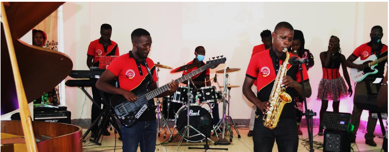
IMLS-Band bei einem Live-Stream-Auftritt auf Facebook und Youtube

Nachdem in Uganda die Schulen Coronabedingt lange Zeit geschlossen waren, durfte ab dem 29. März der Schulbetrieb an der IMLS wieder voll aufgenommen werden. Die Instrumentalschüler konnten wieder im Einzelunterricht, bzw. in der Band mit großem Eifer üben. Auf diesen ersten Neustart mit Schülerzuwachs folgte ab 7. Juni leider wieder ein Lockdown. Die nunmehr gut eingespielte Brassband konnte jedoch weiterhin im Freien üben und verbuchte gegen Ende des Jahres diverse Auftritte. Auch die IMLS-Band, bestehend aus mehreren Lehrern und Schülern blieb weiter aktiv und erfreute seit diesem Jahr mit Livestreams auf Youtube und Facebook sowie