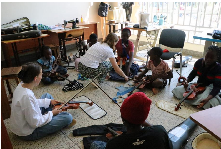
Freiwillige beim Geigenunterricht

Eine große Bereicherung ist der Einsatz von insgesamt fünf neuen Freiwilligen, die ab März 2021 endlich wieder vor Ort Unterricht geben können. In Gesang, Klavier, Geige, Blockflöte, Cello, Klarinette, eine Freiwillige sogar in Orchesterleitung, geben sie Ihr Wissen weiter. In Lockdown-Zeiten, in denen nur wenig Unterricht möglich war, halfen die Freiwilligen etwa das Instrumentenlager zu ordnen, bauten Regale auf und reparierten Instrumente.