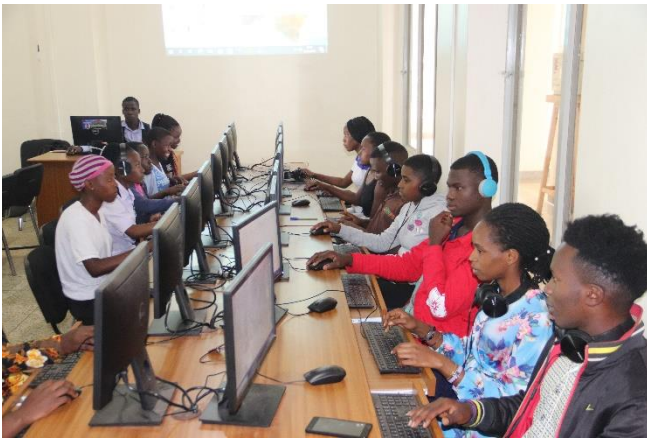
Information Technology (IT)

Alle Schüler der IMLS erhalten nach Abschluss einer bestandenen Prüfung auch staatlich anerkannte Urkunden und Abschlusszeugnisse, da die IMLS den Lockdown genutzt hat, um diverse staatliche Anerkennungszertifikate/Akkreditierungen zu erhalten. Somit ist sie seit 2021 vom staatlichen Ministerium für Bildung anerkannt und darf staatliche Prüfungen durchführen.