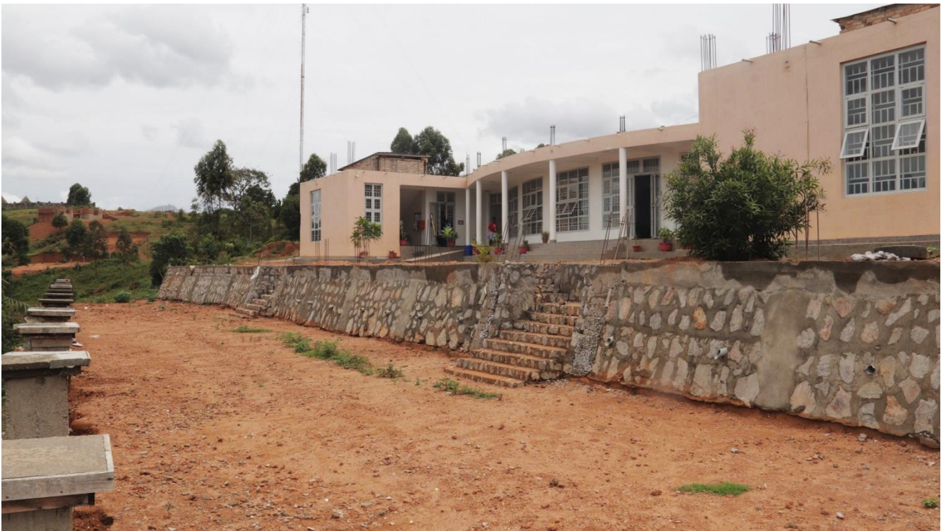
Zwischenstand Obere Hangstützmauer

Eine Herausforderung bietet die steile Hanglage, auf der sich die IMLS befindet, da das Gebäude trotz des tiefen Fundaments durch gelegentlichem Starkregen und damit einhergehenden Hangabspülungen mittelfristig gefährdet ist. Es wurde dringend eine Hangstützmauer benötigt. Der Baustart dieses zusätzlichen umfangreichen Bauprojekts startete mit dem Ziel, zwei versetzte Mauern mit einer Gesamthöhe jeweils von acht Metern auf hundert Meter Länge fertigzustellen. Die hohen Kosten von rund 60.000 € werden größtenteils dankenswerterweise mit einer Spende der Stadema Stiftung in Höhe von 50.000 € abgedeckt. Die Fertigstellung ist für 2022 geplant.