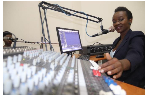
Journalism and Mass Communication