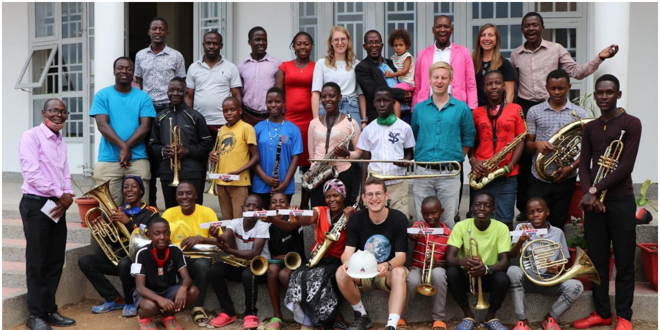
OTH-Studierende mit Brass-Band Mitgliedern und IMLS-Mitarbeitenden

den qualifizierten Brunnenbauern statt. Hierbei wurde festgestellt, dass der bereits existierende Brunnen der IMLS zur Säuberung des Wassers und zum Schutz der Pumpe durch Betonringe noch etwas verbessert werden musste. Der Einbau dieser Ringe wurde mit den Menschen vor Ort umgesetzt. Um der steigenden Schülerzahl gerecht zu werden, wurden darüber hinaus Möglichkeiten entwickelt, die Wassermenge zu vergrößern und die Abwassersammelanlage zu erweitern. Ebenso wurde die Notwendigkeit eines zweiten Brunnens erkannt und eine Vermessung des gesamten Geländes mit allen Höhen und Tiefen durchgeführt.