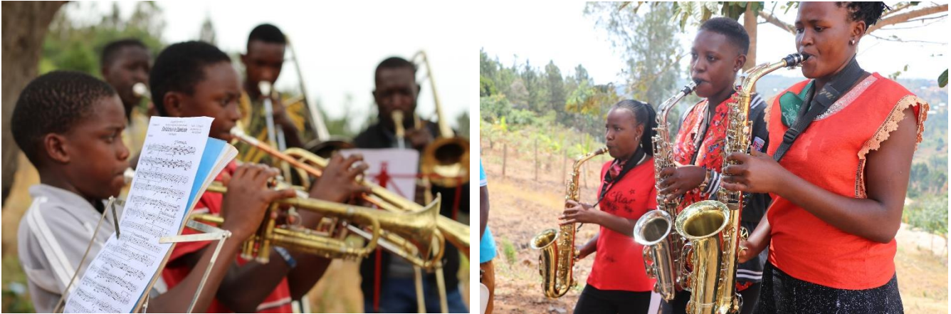
Instrumental- und Ensembleunterricht im Freien

Nachdem in Uganda die Schulen Coronabedingt lange Zeit geschlossen waren, durfte ab dem 29. März der Schulbetrieb an der IMLS wieder voll aufgenommen werden. Die Instrumentalschüler konnten wieder im Einzelunterricht, bzw. in der Band mit großem Eifer üben. Auf diesen ersten Neustart mit Schülerzuwachs folgte ab 7. Juni leider wieder ein Lockdown. Die nunmehr gut eingespielte Brassband konnte jedoch weiterhin im Freien üben und verbuchte gegen Ende des Jahres diverse Auftritte. Auch die IMLS-Band, bestehend aus mehreren Lehrern und Schülern blieb weiter aktiv und erfreute seit diesem Jahr mit Livestreams auf Youtube und Facebook sowie