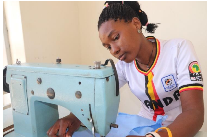
Fashion and Design