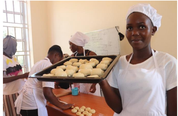
Catering and Hotel Management

Für alle Ausbildungsbereiche wurden eigene Räumlichkeiten eingerichtet und Lehrkräfte eingestellt, die die IMLS selbst trägt. Um die zweihundert Schüler beginnen in den letzten beiden Monaten noch eine Berufsausbildung, viele auch von weit her, für die die IMLS nun zwei Häuser in der Nähe der IMLS anmietet, die als Internat für die Schüler dienen. Die Miete wird komplett durch die IMLS und Schülerbeiträge zur Berufsausbildung finanziert. Der FMK steuerte zum Start eine Anschubfinanzierung für Betten bei.