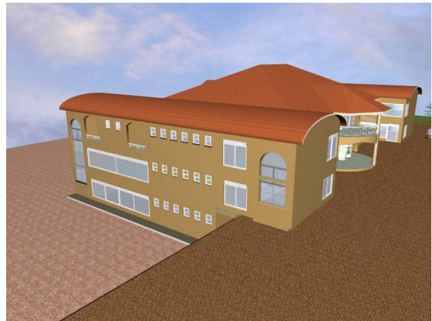
Computeranimation der IMLS