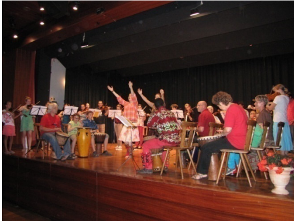
Schüler und Freunde der Musikschule Neckartailfingen beim Deutsch- Afrikanischen Begegnungskonzert in Aich