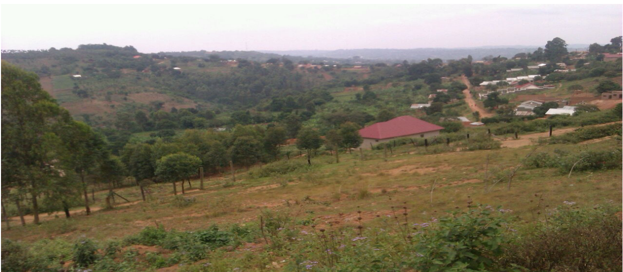
Hier über der Stadt Masaka soll die IMLS erbaut werden

Förderverein für Musik und Kultur Uganda e.V., Prinzenweg 15, 93047 Regensburg