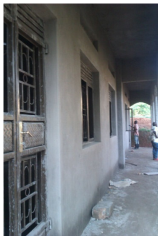
Türen und Fenster

In dem Chorsaal soll nun bald Musikunterricht und musikalisch-chorische Bildung für die Kinder vor Ort stattfinden.