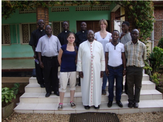
IMLS &Friends - Mitglieder mit Gästen aus Deutschland

Um diese Visionen wahr werden zu lassen, steht zunächst der Bau der ca. 200.000€ teuren Schule an. Für die Finanzierung haben sich dieses Jahr Vereinsmitglieder, Freunde, Spender und Sponsoren in verschiedensten Aktivitäten engagiert. Vor allem die euro-afrikanischen Himbisa Mukama Benefizkonzerte trugen viel dazu bei (siehe Kapitel Himbisa Mukama Konzert).