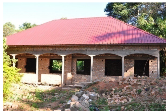
Rohbau des Chorsaals, Diözese Masaka/Uganda

Da die Mittel von 2012 nun leider erschöpft sind, hat sich der FMKU in Kooperation mit der Diözese und