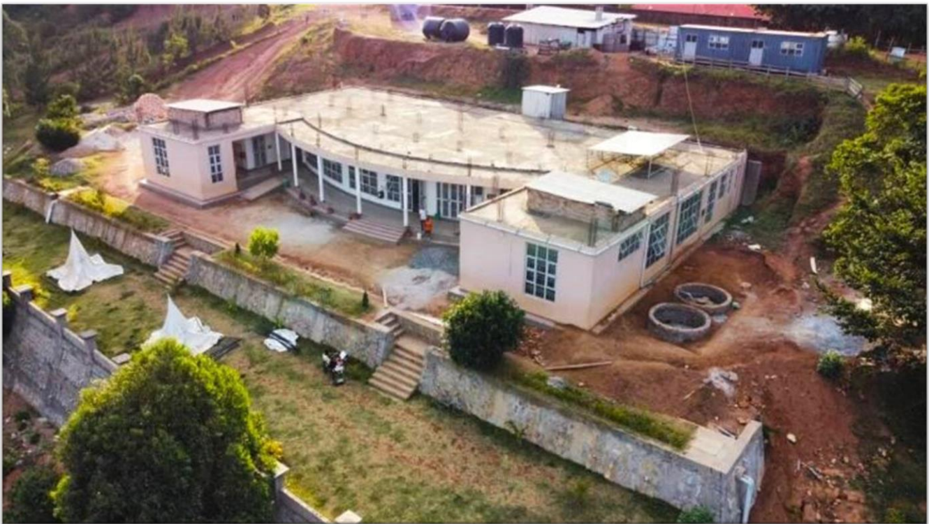
IMLS aus der Luft 2023

Wegen technischer Notwendigkeiten wurde die Vereins-Homepage, neu aufgesetzt, überarbeitet und zukunftsfähig umgestellt.