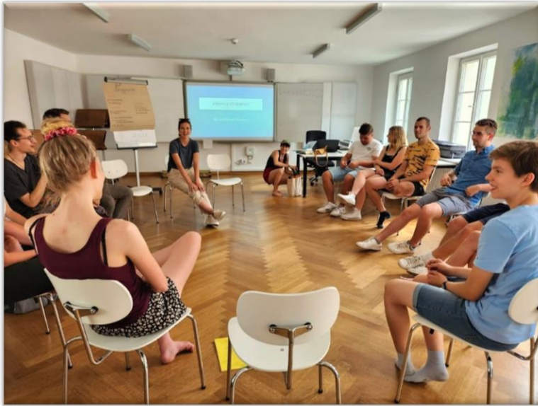
Musikpädagogisches Kulturvorbereitungsseminar für Freiwilligendienstleistende

Vom 7. bis 9. Juli 2023 erhielten die neuen Freiwilligendienstleistenden sowie Studierende der OTH Regensburg, ein Vorbereitungsseminar für ihren bevorstehenden Aufenthalt in Uganda.