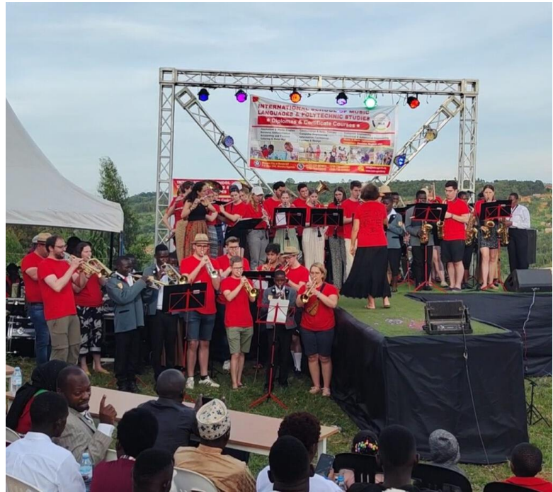
Osterkonzert der IMLS-Brassband zusammen mit den Bigbands des Regentalgymnasiums Nittenau und des Albrecht Altdorfer Gymnasiums Regensburg an der IMLS in Maska/Uganda

In den Osterferien fand darüber hinaus ein besonderer Austausch mit Blasorchestern der IMLS und Oberpfälzer Gymnasien statt. So reisten die Bigbands des Regensburger Albrecht Altdorfer Gymnasiums und Nittenauer Regentalgymnasiums für musikalische Austauschaktionen nach Uganda. Über die Osterfeiertage besuchten sie auch die IMLS und studierten zusammen mit der IMLS-Brassband mehrere Stücke ein. Diese wurden dann am Ostersonntag im Rahmen eines Osterkonzerts aufgeführt. Erstmals stellten zu diesem Anlass auch die Berufs-