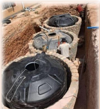
5 Wasserzisternen konnten mit Hilfe Studierender der OTH Regensburg realisiert werden

ausbildungszweige der IMLS an bunten farbenfrohen Ausstellungsständen ihre hergestellten Produkte und ihr Können für die interessierten Besucher dar. Auch die Oberbürgermeisterin Masakas, Florence Namayanja, besuchte das musikalische Osterfest an der IMLS. Sie war bereits im vergangenen Jahr im Rahmen des letztjährigen Austauschprojekts nach Regensburg gereist und ließ sich von der Musik begeistern.