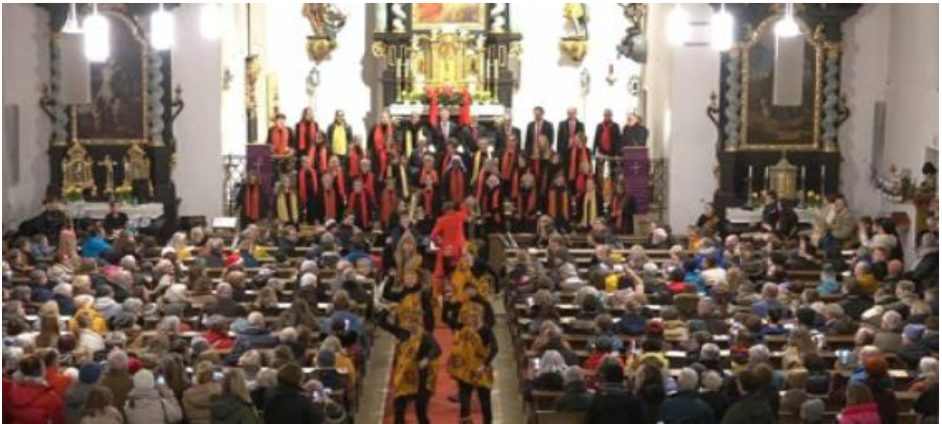
Himbisa Mukama Adventskonzert am 10.12.2023