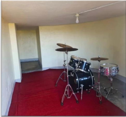
Neu eingerichteter Schlagzeugraum

Zudem konnte der erfolgreiche Abschluss weiterer Einrichtungsmaßnahmen verkündet werden: Der zur besseren Gesundheit der Beschäftigten erforderliche Bau der Außenküche mit Rauchabzug ist abgeschlossen. Die Schulmittel sind in der neu eingerichteten Bibliothek systematisiert und sicher sowie auffindbar untergebracht. Zudem konnte ein Übungsraum für Schlagzeug im Nachbargebäude eingerichtet werden, um ein Üben ohne Störungen für andere zu ermöglichen.